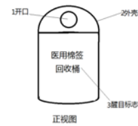
图1 垃圾桶整体外观正视图